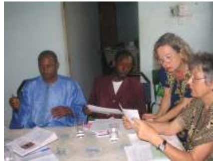
Bei der Planung unseres nächsten Projektes in Maradi/Republik Niger (2006)