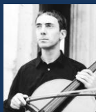
Graham Waterhouse Cello